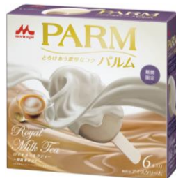
PARM(パルム) ロイヤルミルクティー ~和紅茶仕立て~(6本入り)