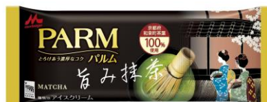
PARM(パルム) 旨み抹茶(1本入り)