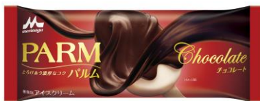
PARM(パルム) チョコレート(1本入り)