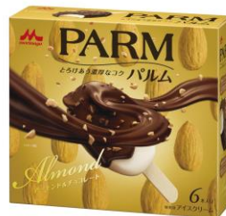
PARM(パルム) アーモンド&チョコレート (6本入り)